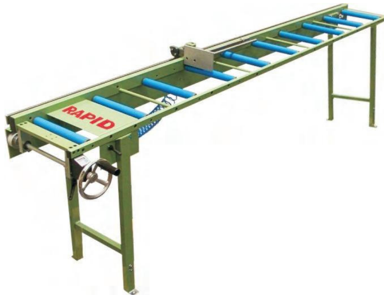
Abbildung 2 Digitaler Längenanschlag RM-DI

mit nach hinten wegklappbarem Materialanschlag, Anschlagschieber über Handrad vom Arbeitsplatz aus verstellbar, elektronische digitale Maßanzeige, pneumatische Verriegelung