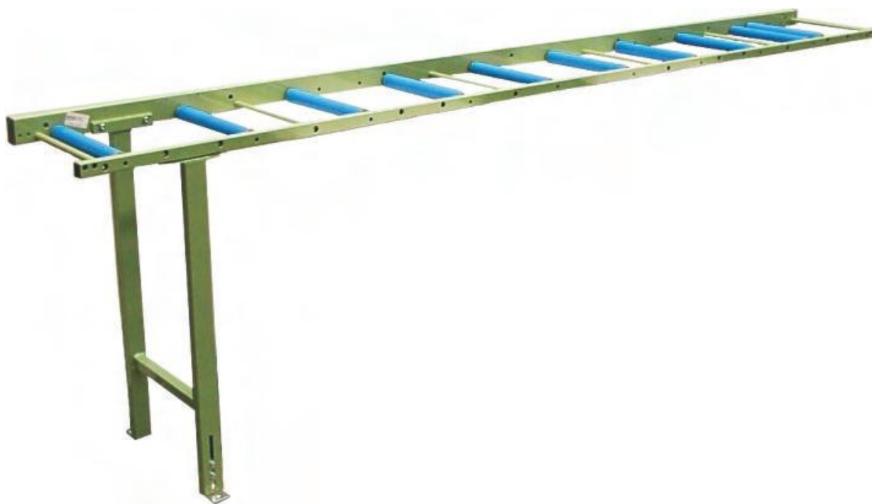
Abbildung 1 Rollenbahnen R