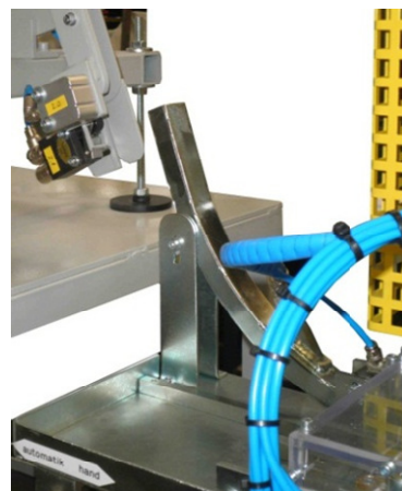
Übergabe der Alu-Halter an das Schraubgerät