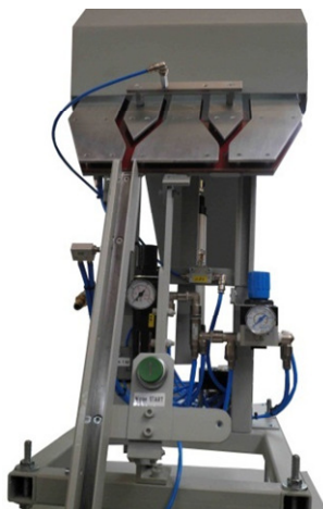
Sortier- und Zuführeinheit RU-SZ -C-D

Auch erhältlich in Verbindung mit einer automatischen Sortier- und Zuführeinheit RU-SZ-C-D für Clip- und Drehhalter. Stangenmagazin/Zufuhrkanal für 25 Halter (19 x 19 mm) Vorratsbehälter 2-teilig wahlweise für Dreh- oder Cliphalter Steuerung pneumatisch mit automatischer Sortiertopfabschaltung.